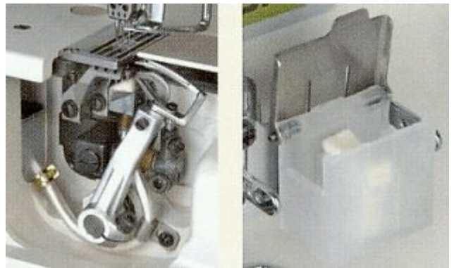
HR-устройството за охлаждане на иглите и конците