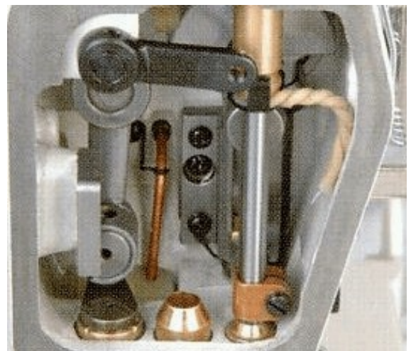
Смазване на иглоносача с маслен фитил и вакумно изсмукване на маслото.