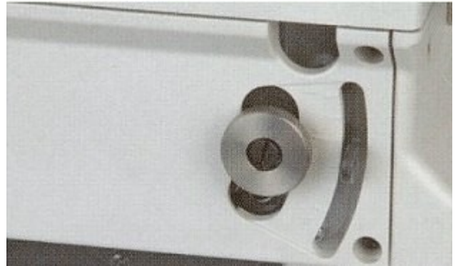
Настройка на диференциалния транспорт отвън.